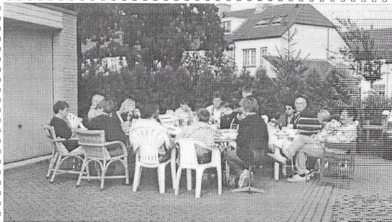
Deelnemers aan het Gheyngholfspel 1998 na afloop van de spannende finale aan de maaltijd.

Nu al nadenken over een spel in september? Is dat niet wat vroeg? Ja en nee. De opzet vergt de nodige voorbereiding, we kunnen bij de organisatie wel wat hulp gebruiken en ..... tussendoor gaan nog diverse mensen met vakantie.