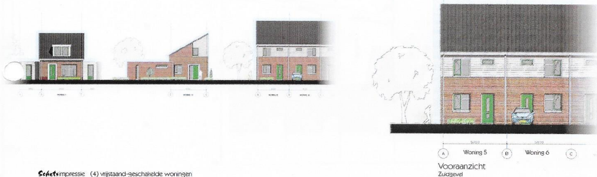
Schetsimpressie (4) vrijstaand-geschakelde woningen